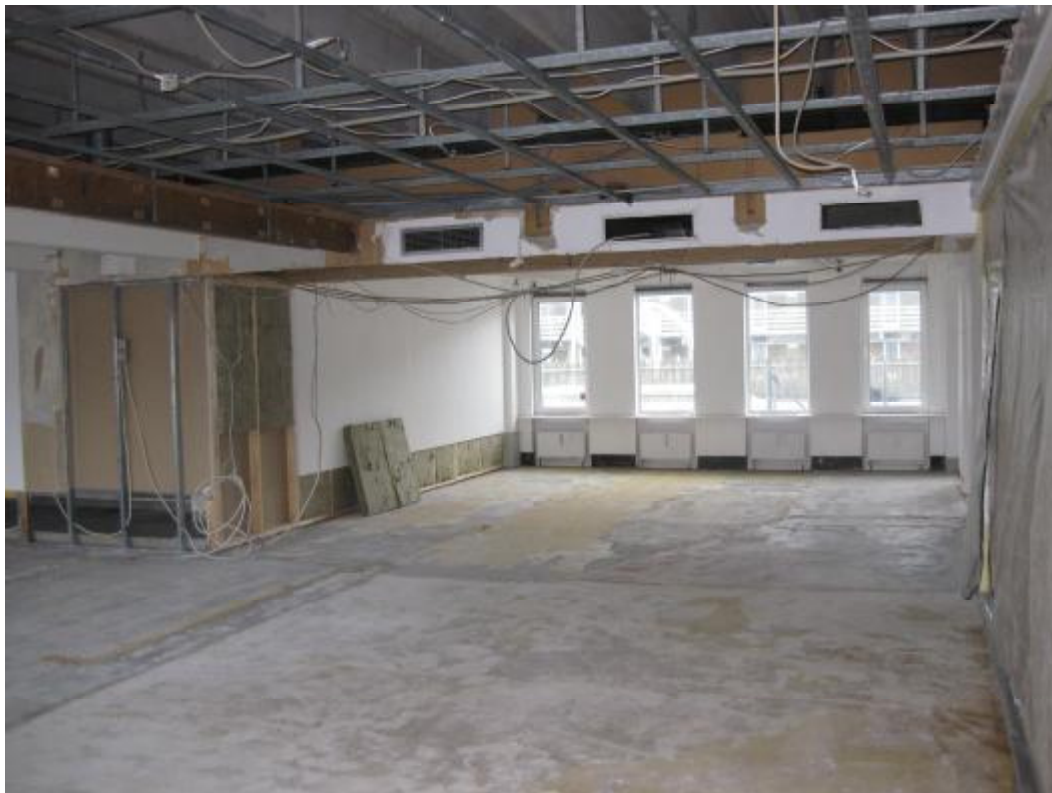
Nedbrydningen er i gang.