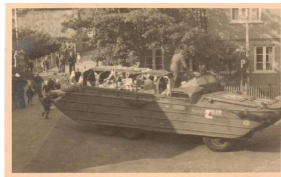
DUKW'en på vej i vandet ved Færgestrاند dækket med dannebrogssflag og fyldt med lokale. Til højre er den parkeret på Tinghustorv.