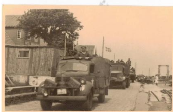
T Force ankommer til Fanø med færgen og kører sydpå langs Sønderbro, hvor man kan se tipvognstogets spor.